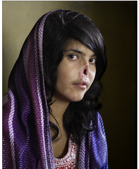
Das Bild hat Menschen in aller Welt geschockt: Eine junge Frau, deren Nase offenbar mit brutaler Gewalt abgeschnitten wurde. Taliban-Krieger und ihr Ehemann waren die Täter. Das Porträt der verstümmelten Afghanin wurde Pressefoto des Jahres 2010.

Die Geschäftsführerin und künstlerische Leiterin Gisela Kayser persönlich führt uns durch die diesjährige Ausstellung, die in der Hauptstadt exklusiv nur im Willy-Brandt-Haus zu sehen ist.